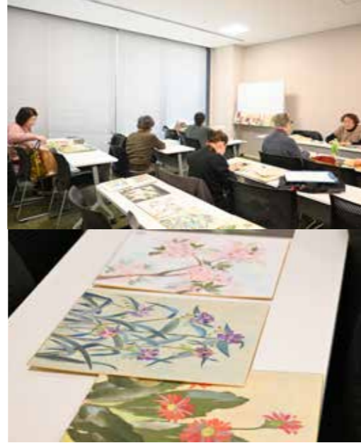
それぞれが制作に集中しながらも、お互いを尊重し合い、なごやかに活動されている様子が印象的でした。