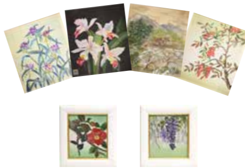
▶季節ごとの花や風景をちぎり絵で表現されています。