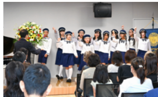
枚方市青少年少女合唱団のみなさん

現在、このグランドピアノは大集会室に設置され、地域の多くの団体に利用していただき、その美しい音色とデザインから、利用者にとても人気があります。また、2025年3月には「グランドピアノを弾いてみよう」を開催いたします。このイベントで