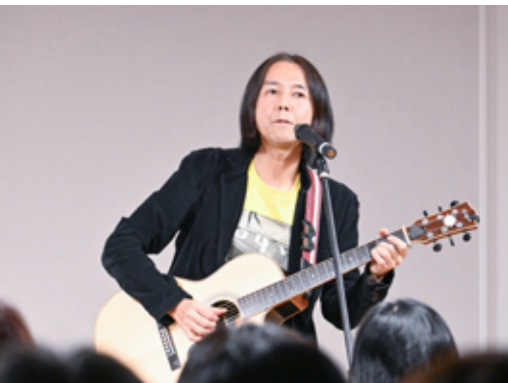
講演会の最後はサプライズで生演奏もあり、温かい拍手に包まれながら幕を閉じました。

ーこれまで活動されてきた中で、さまざまな交流を経験されたと思いますが、その中で特に「難しい」と感じた交流の場面はあり