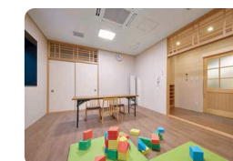
フリールーム 定員:15人